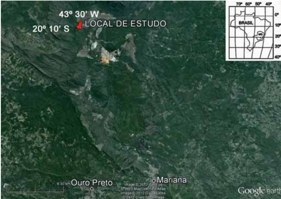
FIGURA 1 – Localização da área de estudo, na Serra de Antonio Pereira, no distrito de Antonio Pereira, Ouro Preto, MG.

classificação analisa a posição e proteção dos órgãos de crescimento (gemas e brotos) durante a estação climática desfavorável.