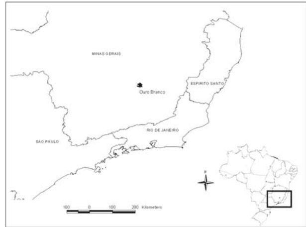
Figura 1. Localização do município de Ouro Branco, Minas Gerais, sudeste do Brasil.

A região de Ouro Branco (20°31'S - 43°41'W), MG, distante 98Km da capital do estado (Figura 1), Belo Horizonte, apresenta aspectos fisionômicos bastante particulares, incluindo serras, com gradientes altitudinais entre 900 e 1600 metros. Situado no extremo sul da Cadeia do Espinhaço, o município possui 261Km 2 de área territorial (IBGE, 2005). O clima, segundo a classificação de Köppen é do tipo Cwb, mesotérmico, com verões suaves e inverno seco, e temperatura média anual