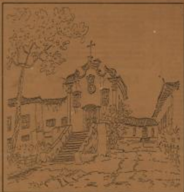
Capela de Santo Domingo, desenhada e pintada por Frei Manoel de São Maria