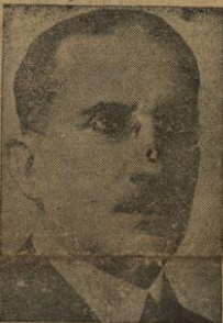
DR. ARTHUR BERNARDES Grande vulto do movimento revolucionario reivindicador e Presidente do P. R. M.

Minas esquecida, desprezada, repudiada, teria, fatalmente, que deslebrar os seus costumes pacificos; teria que deixar o seu arado, voltar a costas aos campos fertilissimos e se pôr em armas, junto aos seus companheiros de padecimentos, para reivindicar os seus direitos. E, assim foi. Levantou-se-lhe o brado bellicoso, a que responderam