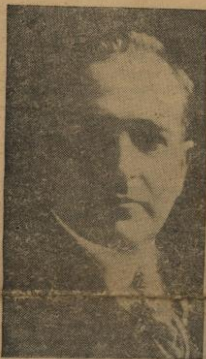
DR. GETULIO VARGAS Chefe do governo revolucionario.

Chegou-se no feliz termino da campanha ingente que os Estados alliados emprenderam, para rechaverem o de que os esbulhara a fraude official. No entanto a simples obediencia aos canones constitucionaes teria evitado a maior convulsão por que já passou a Nação brasileira,