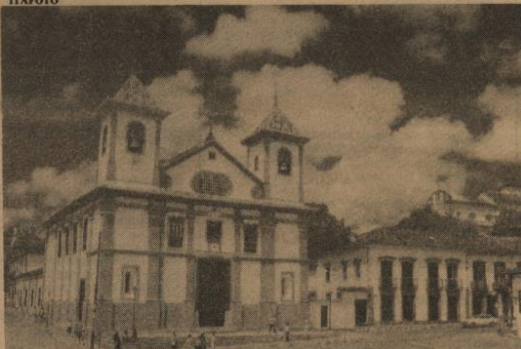
Sé Cathedral Basilica de Nossa Senhora da Assunção, Mariana — MG