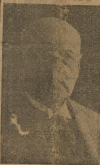
DR. OLEGARIO MACIEL Presidente do Estado e chefe da revolução em Minas.

cio sob os pés. A fraude, a deshumanidade vão aos poucos solapando as mais solidas bases da auctoridade injusta e illegitima: admiram-na, temem-na e tremem deante della, até o momento em que, já não podendo existir, cae com seu