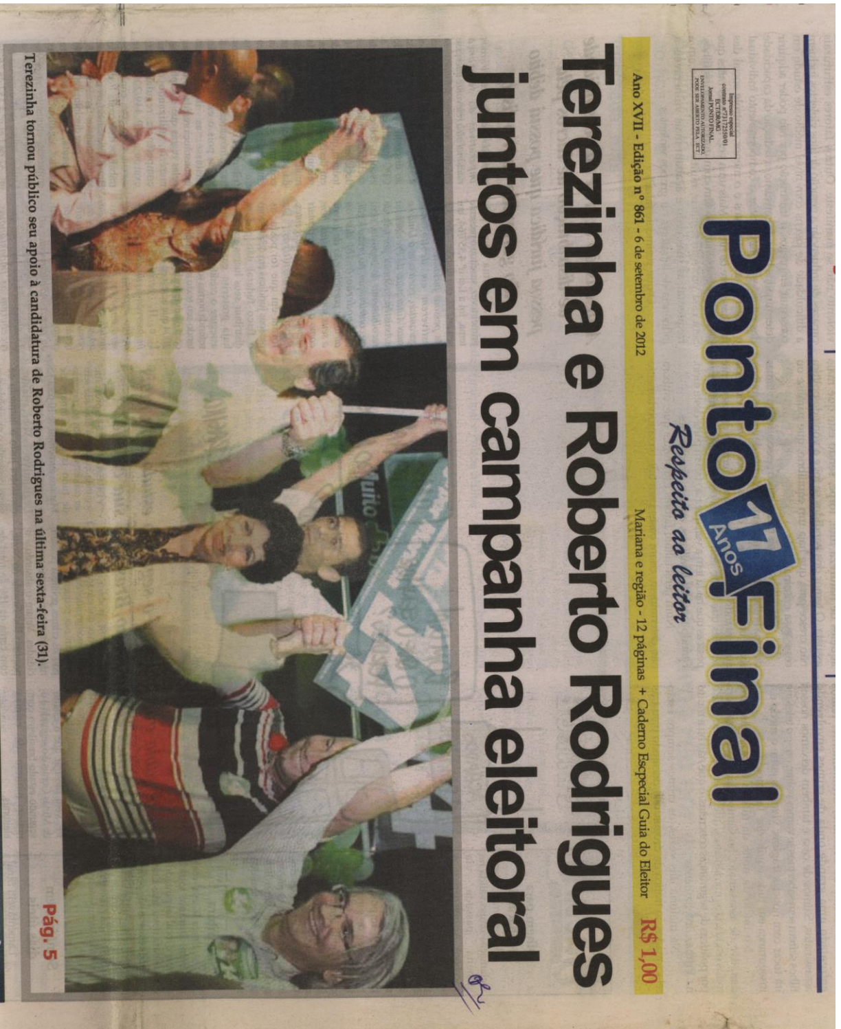
Anexo 7: edição n° 861, de 06 de setembro de 2012, capa.