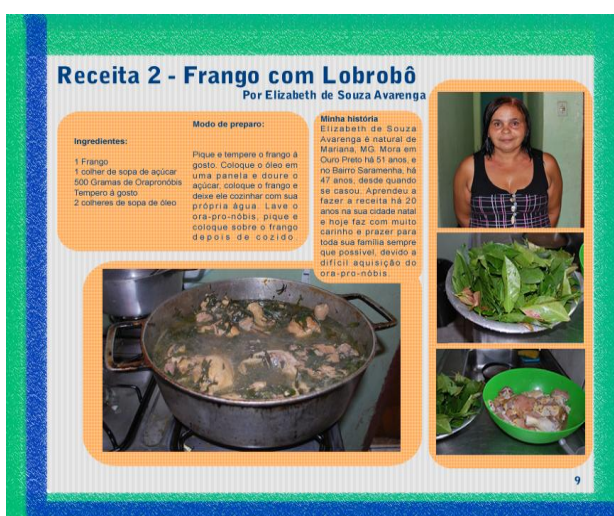
Figura 3 – Página de receita culinária