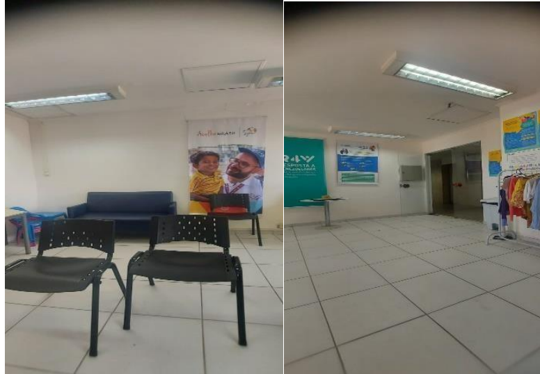
Figura 3 – Recepção do SJMR-BH