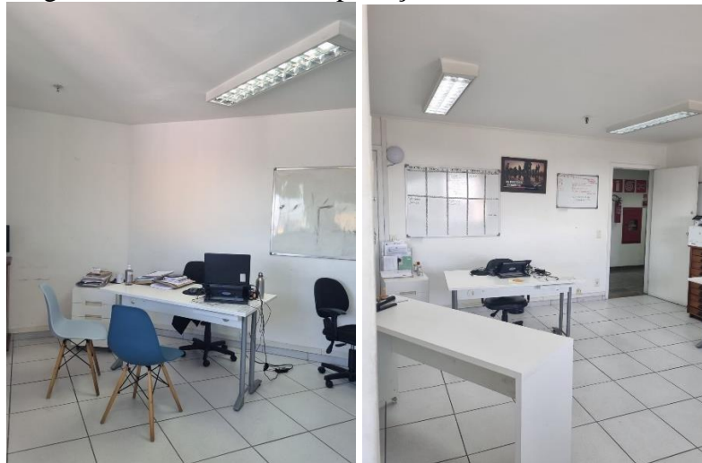
Figura 6 – Sala designada ao atendimento de proteção

Em determinada visita, a pesquisadora é convidada a acompanhar um dos três campos de atendimento oferecidos, a saber: proteção, meios de vida e integração social. O primeiro que é observado é a proteção. Nesse departamento, trata-se de aspectos documentais e jurídicos, como adquirir a CRNM, o protocolo de refúgio, o Cadastro de Pessoa Física (CPF) e auxílio para obtenção de demais documentos necessários para que ocorra a naturalização como brasileiro(a). É oferecida ainda assessoria jurídica quando necessário, mas o SJMR não advoga. Já na sala designada à proteção, Figura 5, há uma breve explicação das funções ali exercidas.