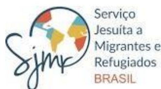
Figura 1 – Logotipo SJMR

Fonte: Disponível em: https://11nq.com/fCMyG . Acesso em: 23 jun. 2023.