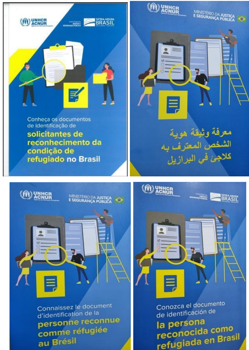
Figura 10 – Cartazes em diferentes línguas para informar migrantes e refugiados