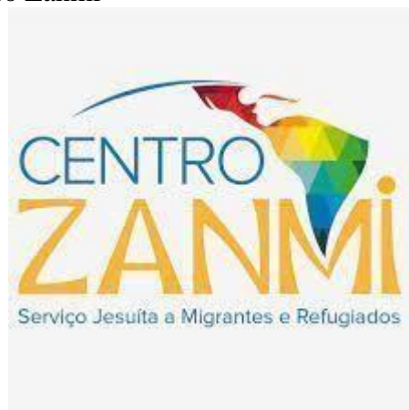
Figura 2 – Logotipo do Centro Zanmi