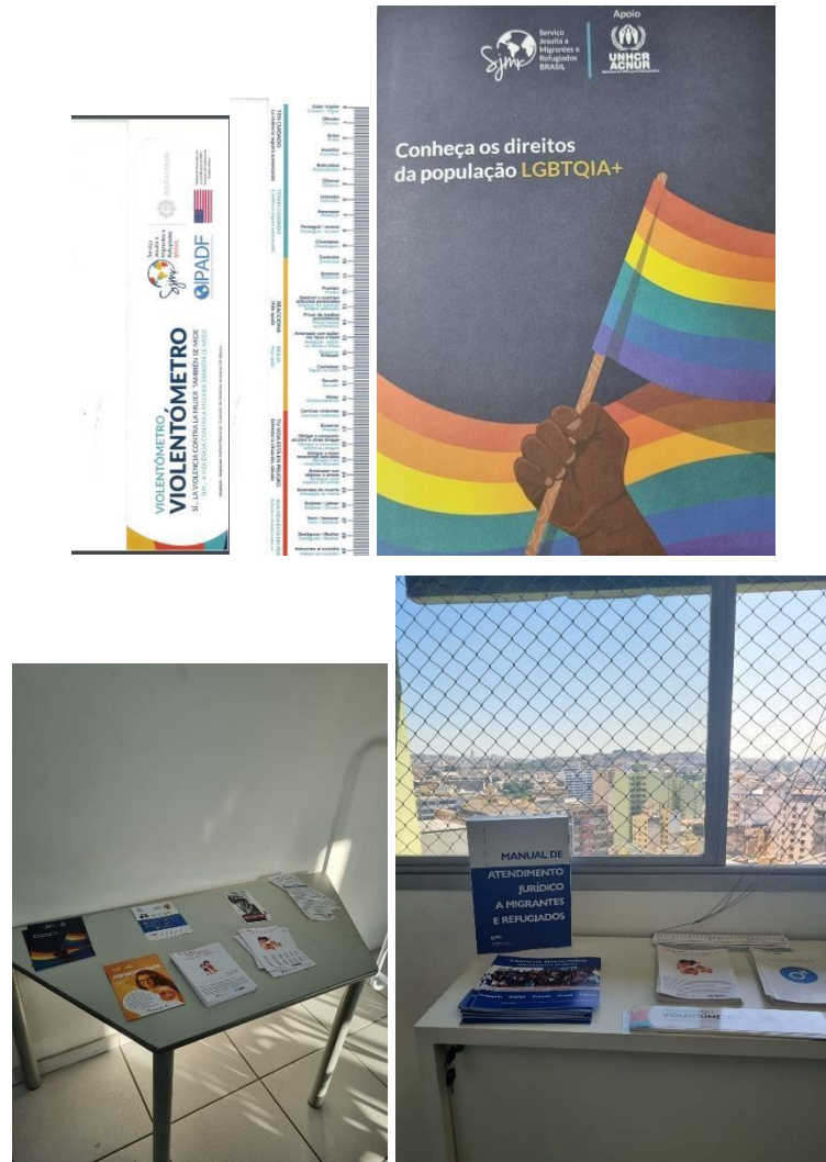
Figura 11 – Folhetos específicos para mulheres e comunidade LGBTQIAPN+