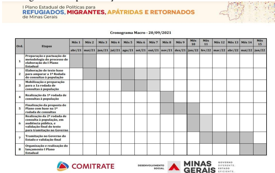
Figura 4 – Cronograma de implementação do Plano

Fonte: Disponível em: https://11nk.dev/8ygn . Acesso em: 05 jan. 2023.