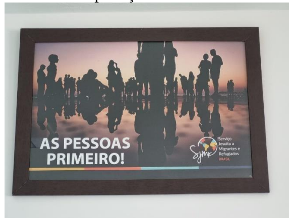
Figura 7 – Quadro disposto na sala de proteção