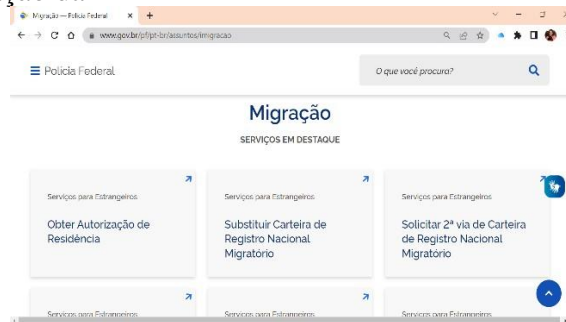
Figura 9 – Site de Migração da PF