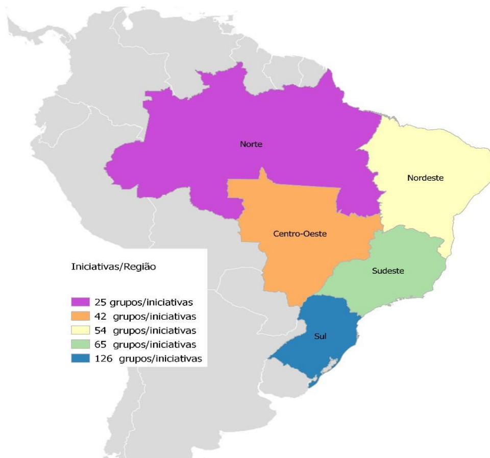
FIGURA 1 - Mapa de iniciativa, programas ou grupos para homens autores de violência contra mulheres por Região.